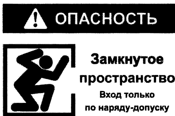
Рекомендуемый знак «ОЗП»

2. Объекты, вошедшие в Перечень 1 и не являющиеся территориально обособленными объектами, должны быть обозначены знаком «ОЗП» (рекомендуемый текст).