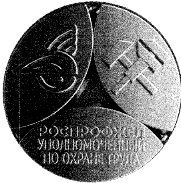
Рисунок Знака «Уполномоченный по охране труда РОСПРОФЖЕЛ»