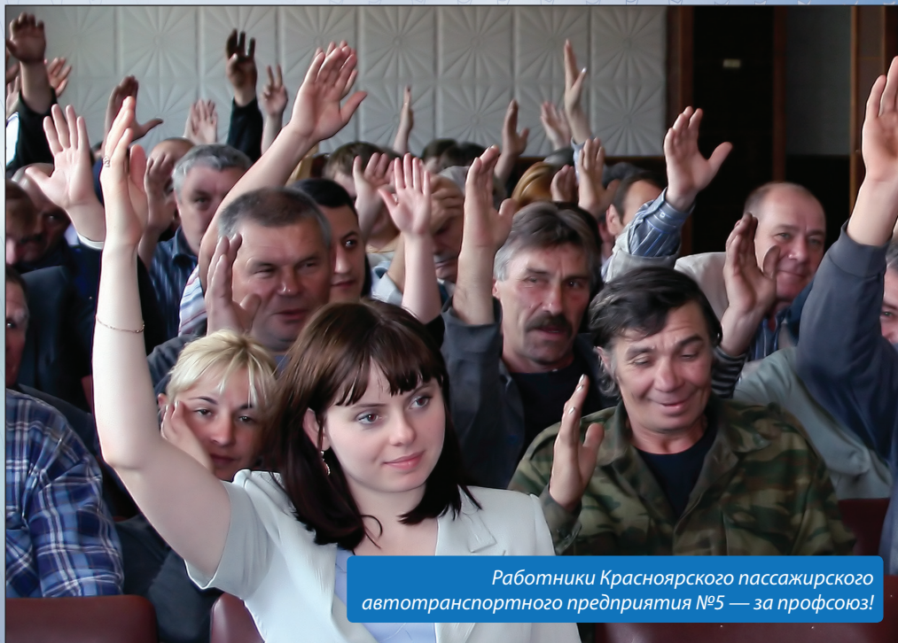
Работники Красноярского пассажирского автотранспортного предприятия №5 — за профсоюз!

В большинстве случаев привлечение к сверхурочной работе, работе в выходные и праздничные дни допускается с учетом мнения профсоюзного комитета первичной профсоюзной организации (или по согласованию, если это предусмотрено коллективным договором).