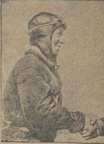
Инструктор аэроклуба т. Шателным вылетом учлета Зубрици