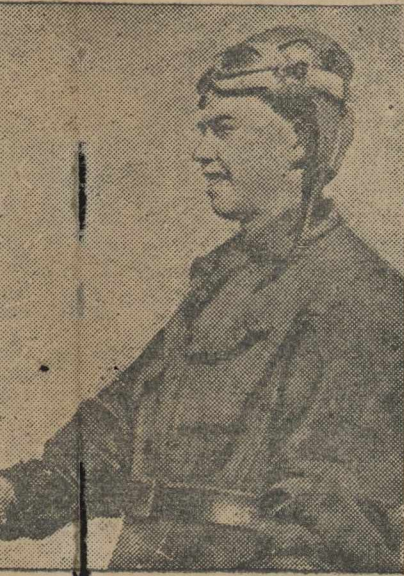
Пилот поздравляет с самостоятельным полетом.

су, где внизу на льдине находилась четверка советских людей, настойчиво слушавших первого посланца своей родины. В 8 часов утра «АНТ-25» перелетел полюс и вступил в зону района полюса неизвестности.