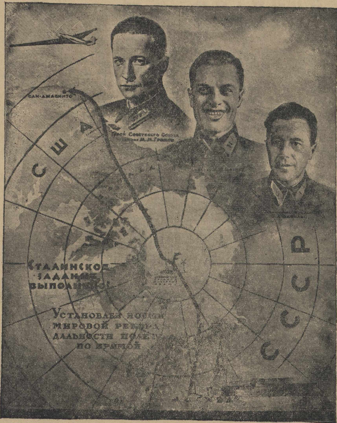
Сталинское задание выполнено! Установлен новый мировой рекорд дальности полета по прямой.